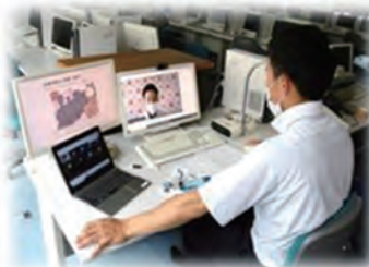
<オンラインでの授業配信>