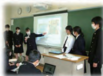
<端末を活用したプレゼンテーション>