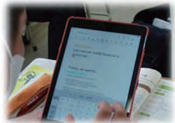
<生徒の理解度に応じた学習>