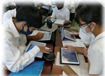
<インターネットを用いた情報収集>

県立高校では、今年度または来年度新入生から生徒1人1台端末を導入しており、授業や家庭など様々な場面で活用しています！