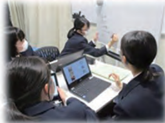
<複数の意見・考えを議論して整理>