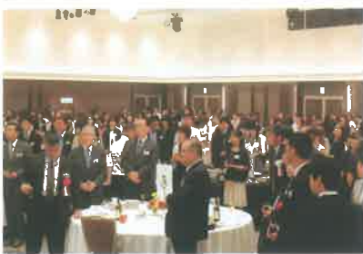
【保護者と教職員の集い】

さて、本校のPTA（育友会）活動は、毎年好評の「保護者と教職員の集い」を岡山駅前のホテルにおいて年1回7月に盛大に開催しております。簡単に紹介しますと、まず各学級の役員が中心となり、リレー電話で参加の呼びかけをしています。当日、ロビーで受付担当の育友会役員から名札プレートを受けとった出席者は、広い会場に所狭ましくクラス単位で準備されたテーブルにつきます。開会挨拶