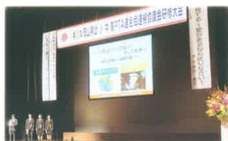
【県立真庭高等学校】