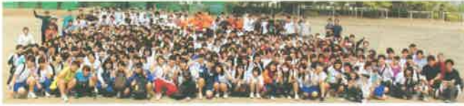
【グリーンクリーン大作戦】

今年度創立43周年を迎えた本校は、建学の精神である「気宇宏大で包容力の大きな人間の育成」に基づいて、世界で活躍するグローバル人材を育成するとともに地域を支えるローカル人材を育成することを目標としております。また、岡山学区南部の普通科進学拠点校として、生徒一人一人の自己実現と将来の職業を見据えた進路実現を目指しております。